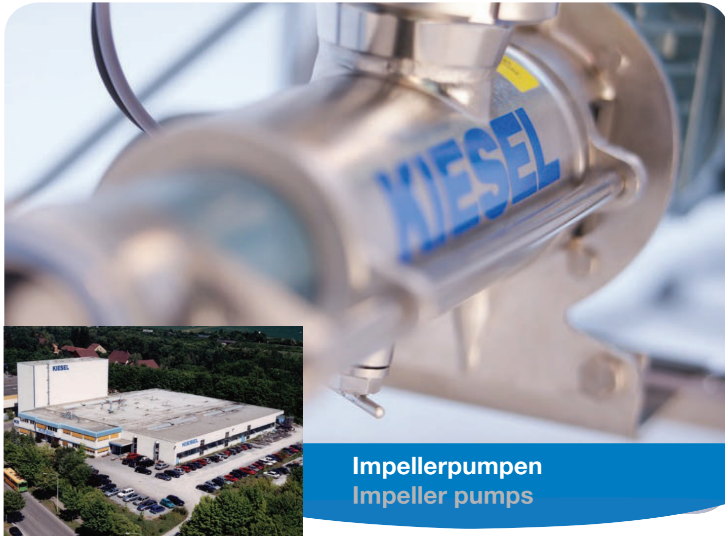
Impellerpumpen Impeller pumps